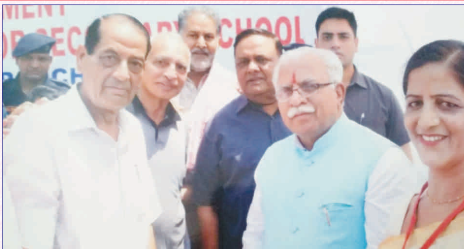
Sh. Manohar Lal Khattar, Hon'ble Chief Minister Haryana inaugurated the RO water plant being presented by Sood Sabha - Sood Sewa Bhawan Trust Chandigarh at Sarthak Govt. Senior Secondary school Sector-12, Panchkula