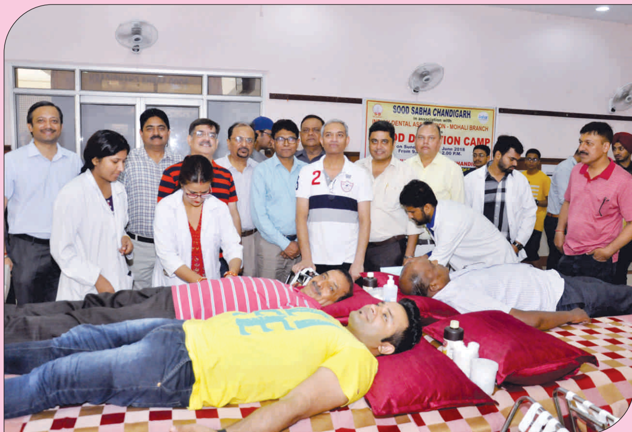
A "Blood Donation Camp" was organised in association with IDA on 10 th June 2018

● Sood Sandesh ₹ 500/- (Membership for ten years)