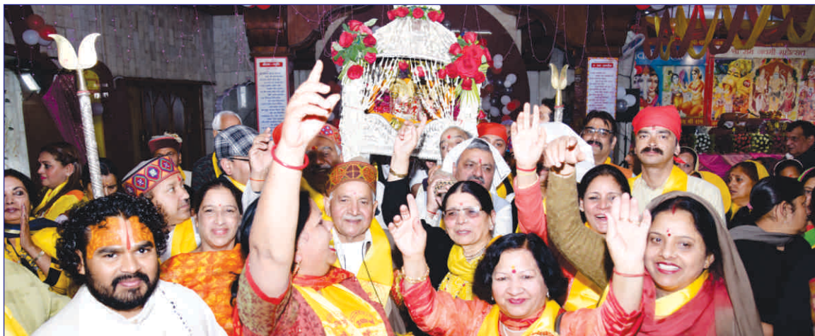
Procession in Shimla