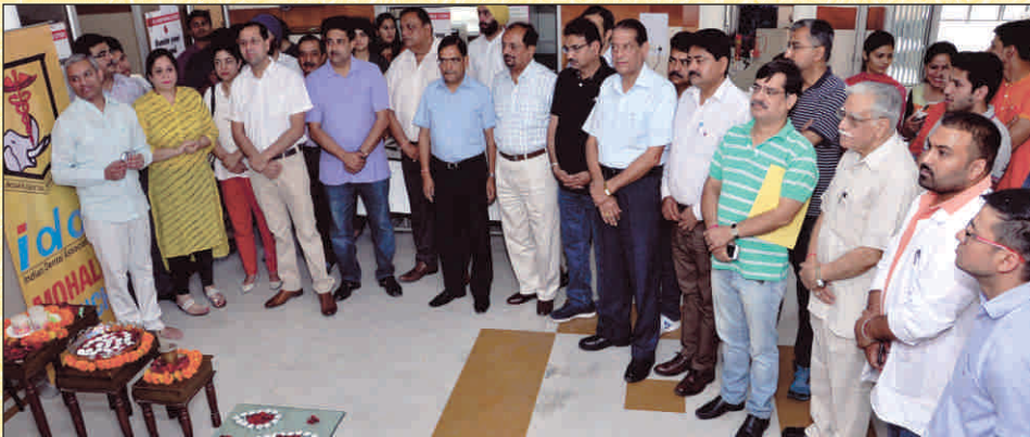
Members of Indian Dental Association and Sood Sabha Chandigarh at the inauguration of camp.