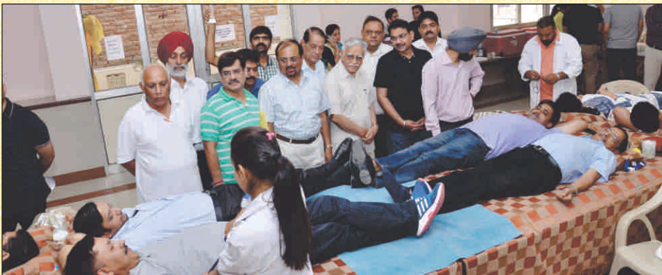
Members of Sood Sabha Chandigarh donating Blood.